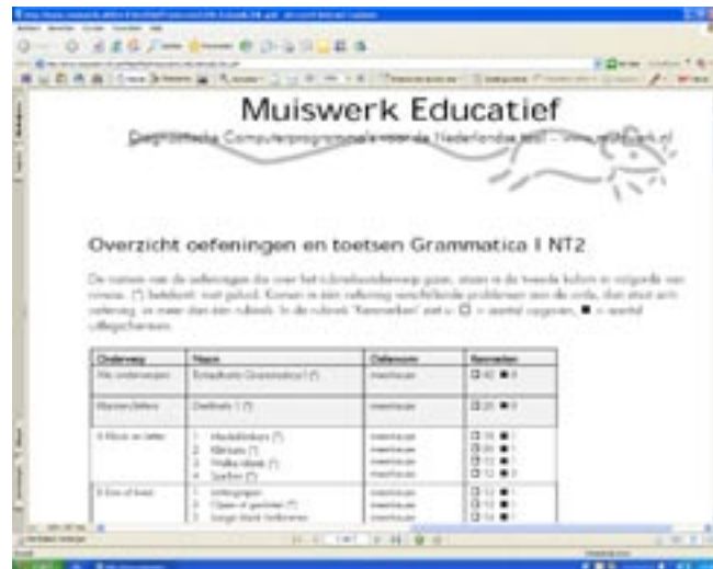
Op de website staat een overzicht van alle oefeningen.

Na een middagje buffelen om alles goed ingesteld te krijgen, is het ook voor de docent een grote aanwinst. Differentiatie wordt voor hem geregeld, de studenten oefenen met dat wat ze nodig hebben. Het programma kan naast elke tweede taalmethode gebruikt worden en het houdt de vorderingen bij die de studenten maken. In mijn ogen een goede aanwinst om de Nederlandse taal te stimuleren en het volgen van onderwijs voor anderstaligen te vergemakkelijken.