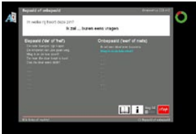
De oefeningen zijn afwisselend.

van het programma zo, dat de studenten er zelfstandig mee aan de slag kunnen. Het vraagt van de gebruiker geen speciale kennis van muis of toetsenbord. Mensen die hier niet mee om kunnen gaan, vragen op dit gebied wel enige extra begeleiding. Het programma stimuleert om verder te werken; het bestaat uit korte opdrachten die duidelijk en helder worden gegeven. De oefeningen zijn afwisselend. Ze nodigen de gebruiker uit actief met de stof bezig te zijn en zetten aan tot denken. Je kunt stoppen wanneer je wilt, natuurlijk wel eerst een oefening afmaken, maar door de compactheid van de oefeningen duurt dit zelden langer dan een paar minuten. De volgende keer dat het programma opgestart wordt en je met je eigen wachtwoord inlogt, ga je verder waar je bent gebleven. Voor de docent is de voortgangsrapportage erg handig om na de lessen te kijken waarmee en hoe zijn studenten aan het werk zijn geweest. Net als de student, heeft de docent zicht op de intaketoetsen, de voortgangstoetsen, score en evaluaties die de computer geeft.