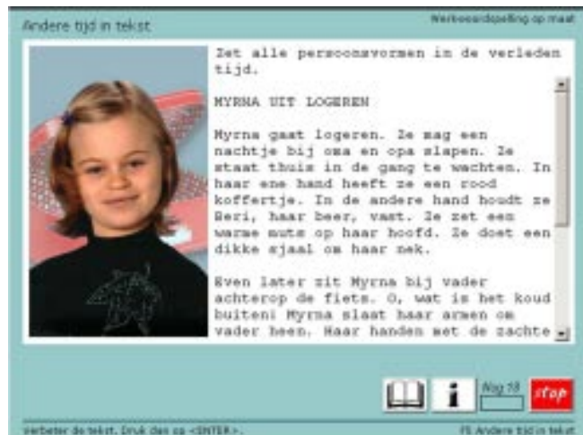
De persoonsvorm in een andere tijd zetten

Het programma is een echte aanrader en ik werd dan ook aangenaam verrast. Uit ervaring weet ik dat de werkwoordspelling in de bovenbouw van het primair onderwijs voor leerlingen problemen oplevert. Natuurlijk verschilt de problematiek vaak per leerling. Door de opzet van het programma kan hulp op maat worden geboden. De diagnostische toets en de automati-